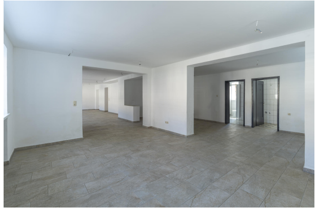
1. OG EZ Wohnung