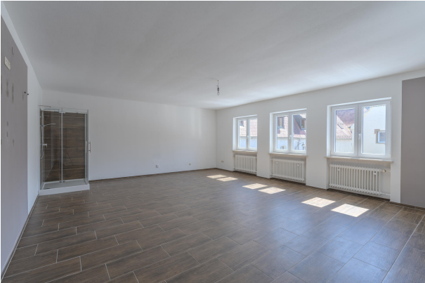
1. OG Wohnung Flur