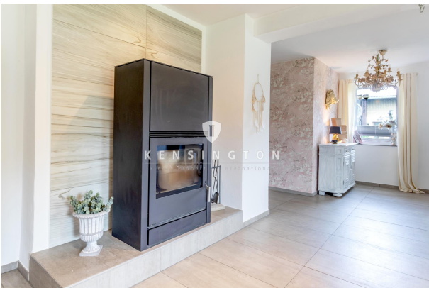
Wohnzimmer Wohnung EG links