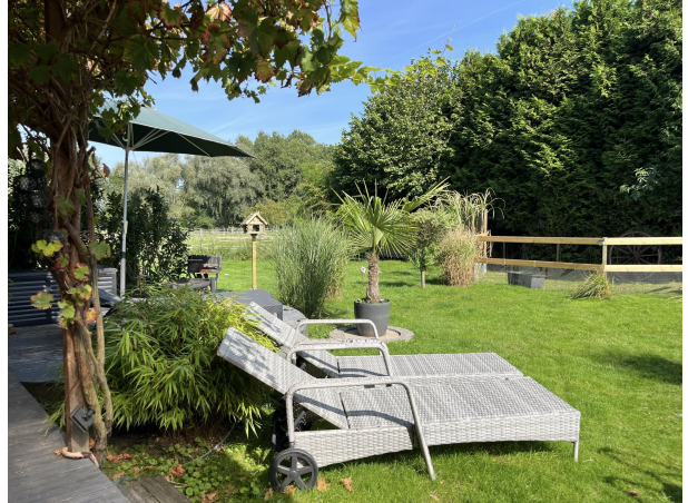
Ruheoase mit Pferden im Garten Wohnung EG rechts